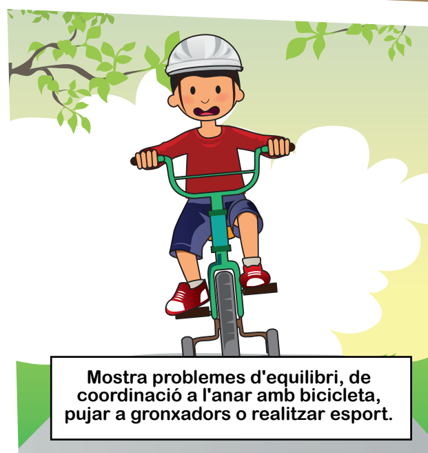
Mostra problemes d'equilibri, de coordinació a l'anar amb bicicleta, pujar a gronxadors o realitzar esport.