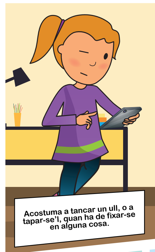
Acostuma a tancar un ull, o a tapar-se'l, quan ha de fixar-se en alguna cosa.