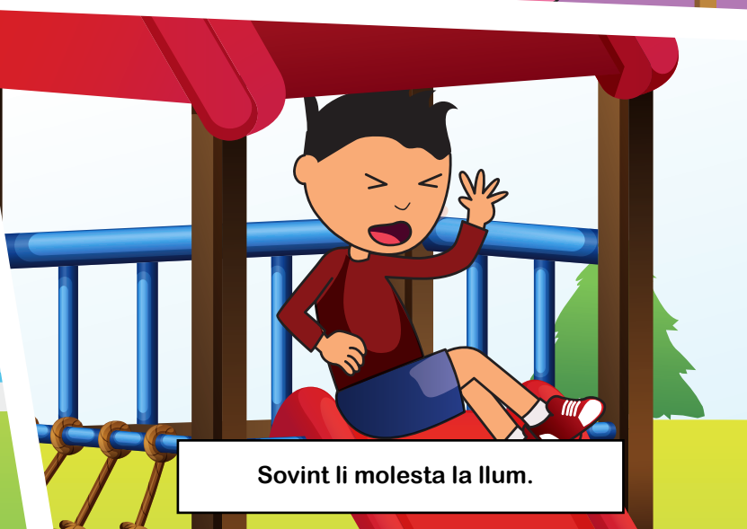
Sovint li molesta la llum.