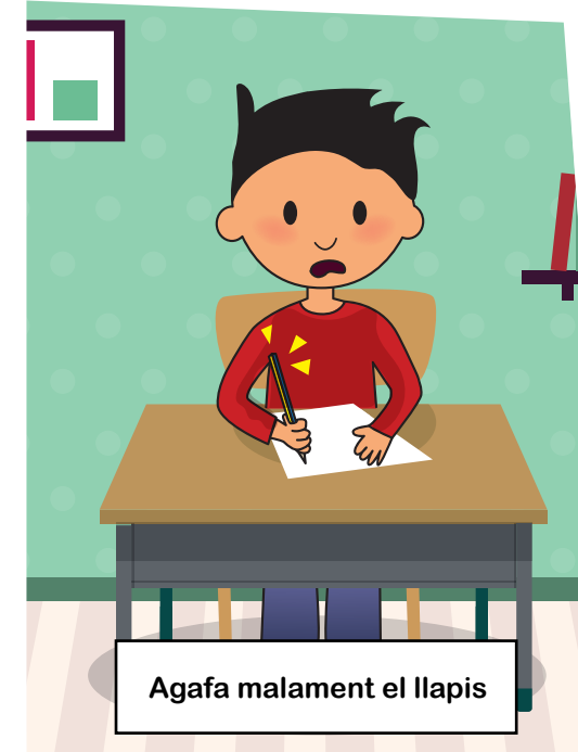
Agafa malament el llapis