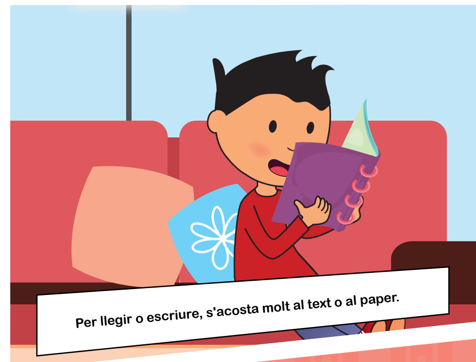
Per llegir o escriure, s'acosta molt al text o al paper.