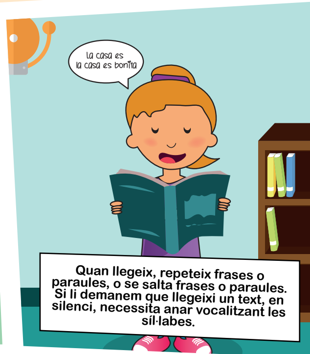
Quan llegeix, repeteix frases o paraules, o se salta frases o paraules. Si li demanem que llegeixi un text, en silenci, necessita anar vocalitzant les síl·labes.