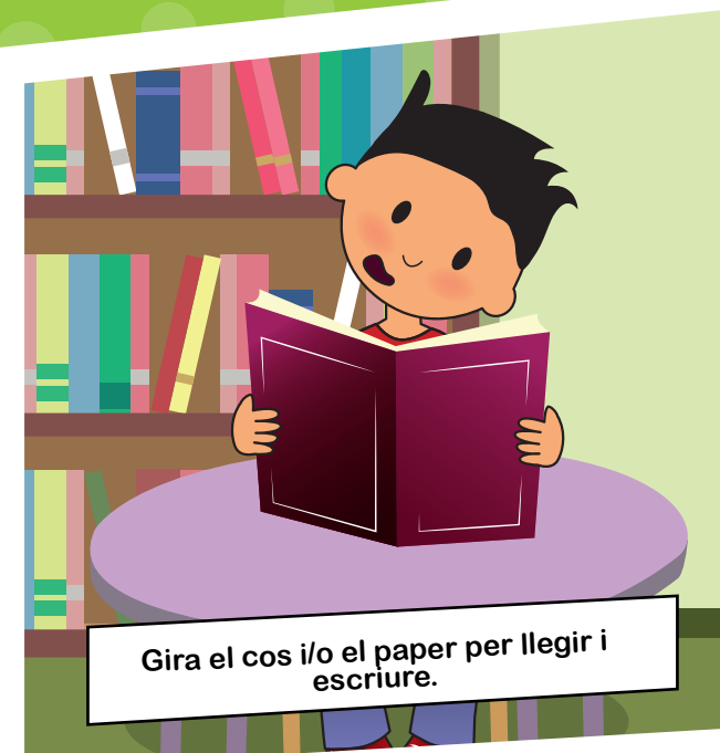
Gira el cos i/o el paper per llegir i escriure.