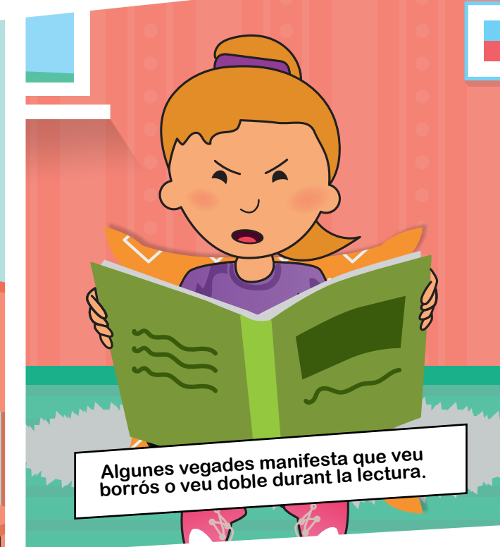
Algunes vegades manifesta que veu borrosos o veu doble durant la lectura.