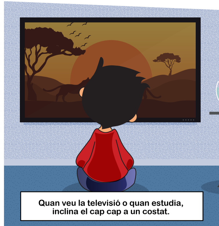
Quan veu la televisió o quan estudia, inclina el cap cap a un costat.