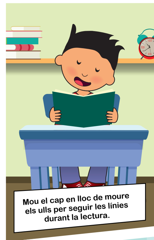
Mou el cap en lloc de moure els ulls per seguir les línies durant la lectura.