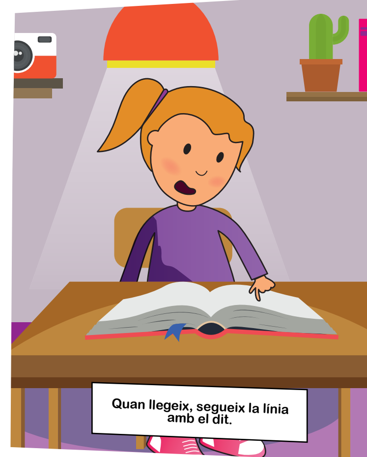
Quan llegeix, segueix la línia amb el dit.