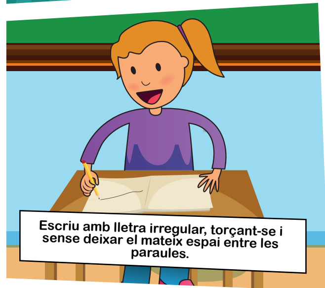
Escriu amb lletra irregular, torçant-se i sense deixar el mateix espai entre les paraules.