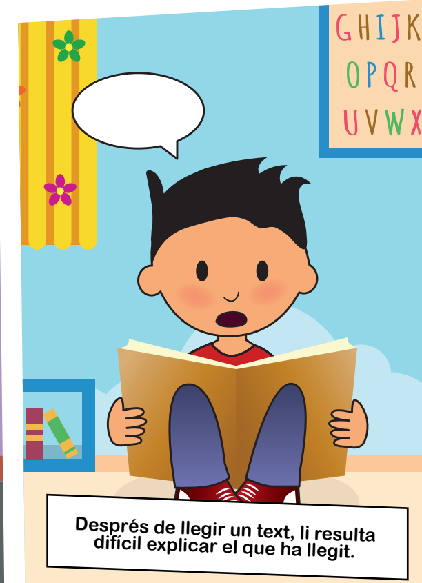
Després de llegir un text, li resulta difícil explicar el que ha llegit.