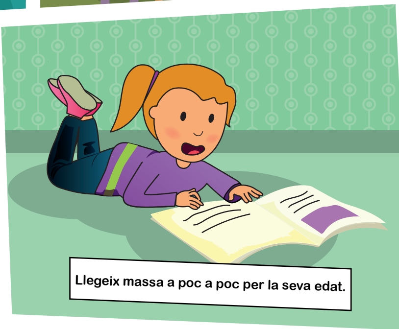
Llegeix massa a poc a poc per la seva edat.