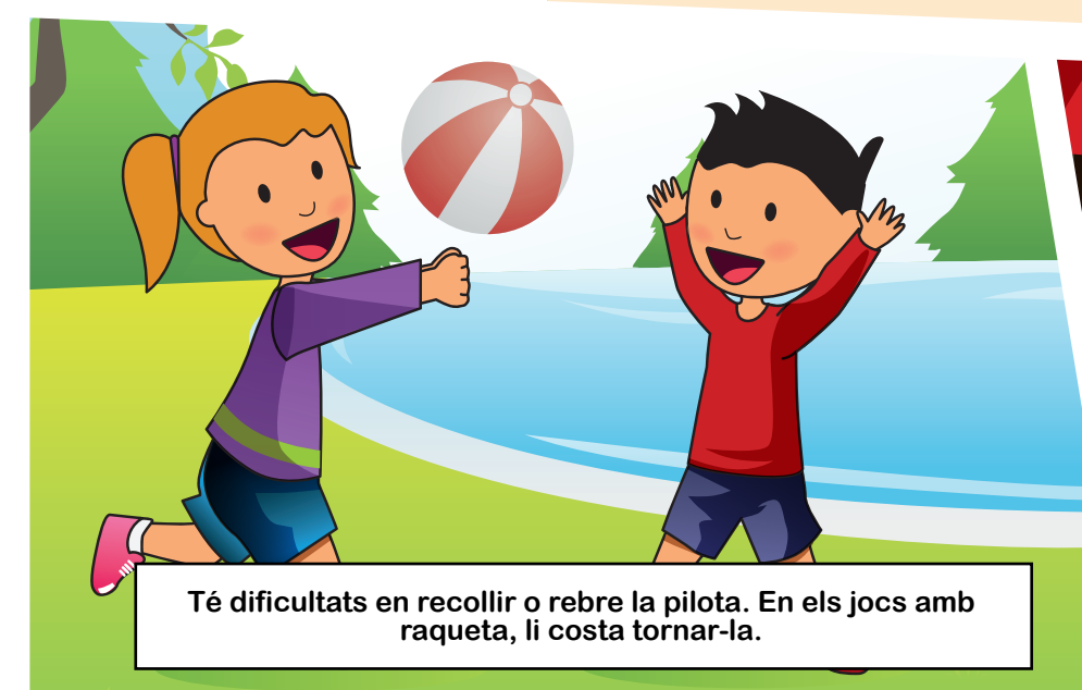
Té dificultats en recollir o rebre la pilota. En els jocs amb raqueta, li costa tornar-la.