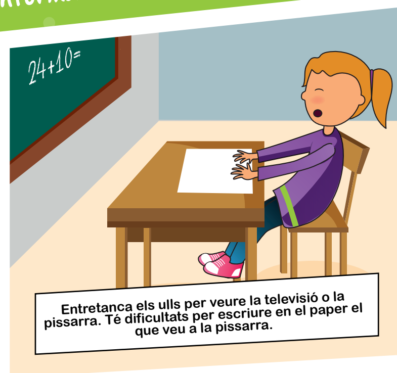
Entretanca els ulls per veure la televisió o la pissarra. Té dificultats per escriure en el paper el que veu a la pissarra.