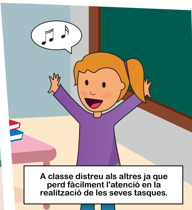
A classe distreu als altres ja que perd fàcilment l'atenció en la realització de les seves tasques.