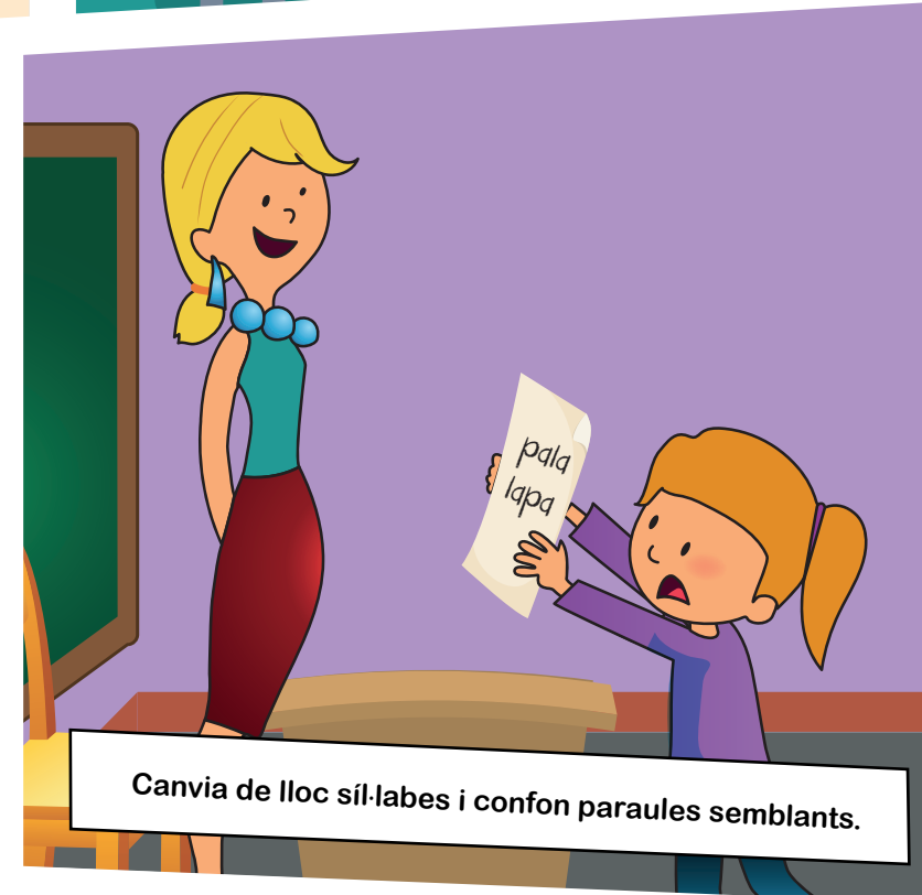
Canvia de lloc síl·labes i confon paraules semblants.