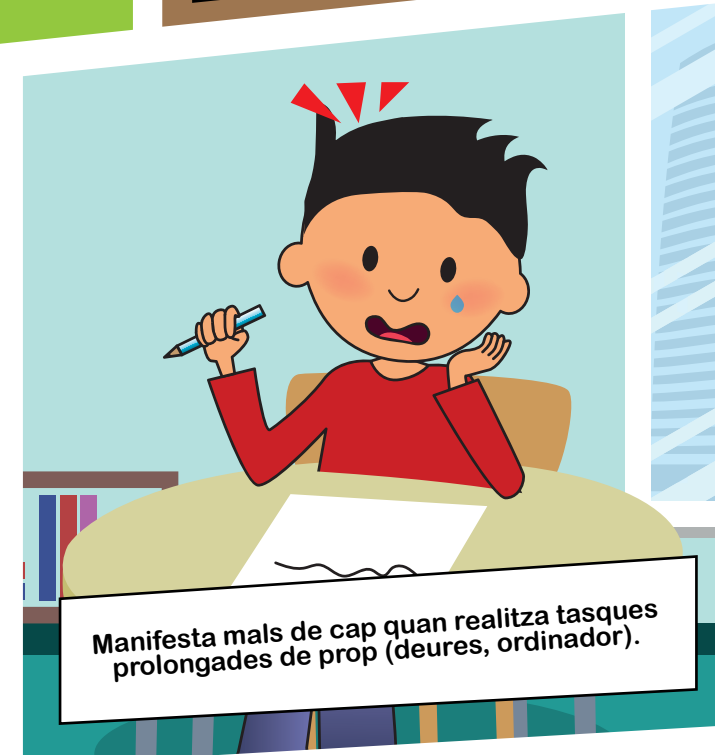
Manifesta mals de cap quan realitza tasques prolongades de prop (deures, ordinador).