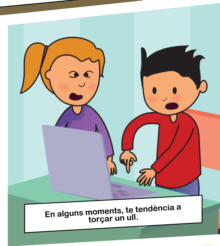
En alguns moments, te tendència a torçar un ull.