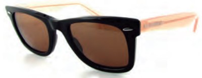
BE NATURAL S18013