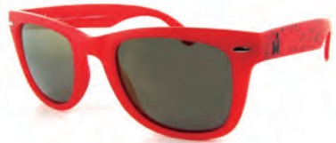
MIRO JEANS S16801