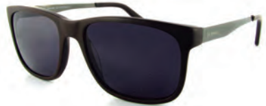
BE NATURAL S18010