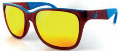
MIRO JEANS S16788