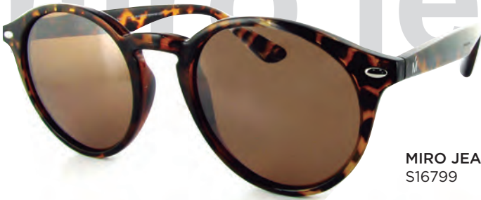
MIRO JEANS S16799