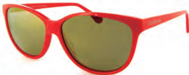
BE NATURAL S17991