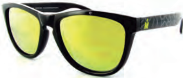
MIRO JEANS S16803