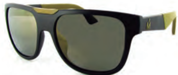
MIRO JEANS S16794