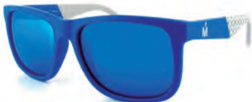
MIRO JEANS S16792