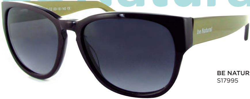
BE NATURAL S17995