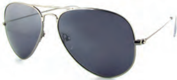
BE NATURAL S18015