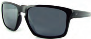
MIRO JEANS S18368