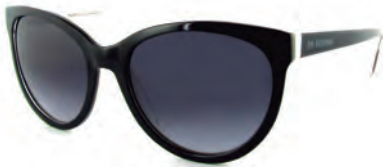
BE NATURAL S17987